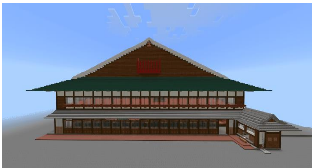
VERYBASE IIZUKAさん作 嘉穂劇場（飯塚市）