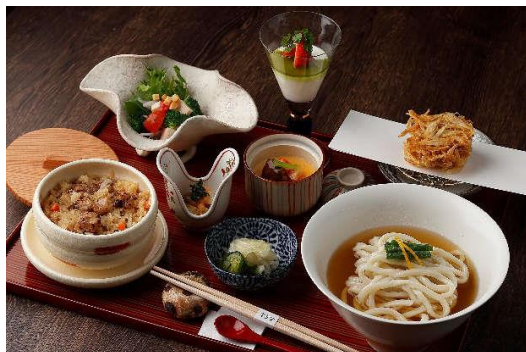
博多ごぼう天うどん